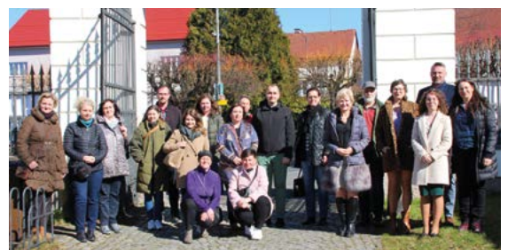
DT-CZ Touristikertreffen in Kdyně

In der grenzüberschreitenden Kooperation haben wir ein weiteres Kapitel aufgeschlagen: Das Aktionsbündnis Čerchov plus ist assoziiertes Mitglied des neu gegründeten Destinationsmanagements Český les . Wir wollen damit eine gute Arbeitsgrundlage für gemeinsame Projekte (Interreg) im Bereich der regionalen grenzüberschreitenden Entwicklung schaffen.