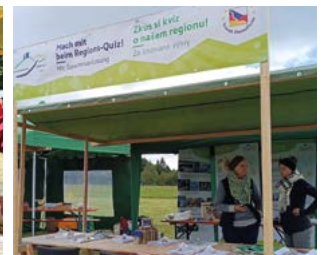
Tag des Grünen Bandes am Aktivzentrum